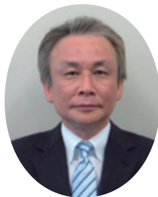
玉川税務署 前署長 高藤一夫