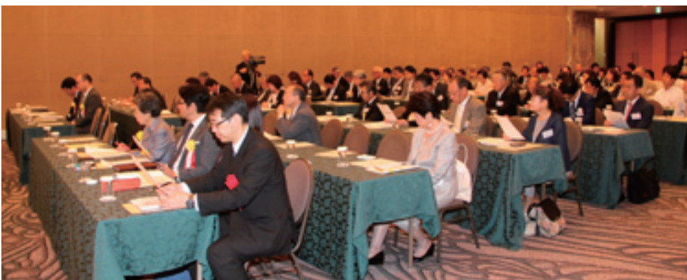
第5回通常総会の様子

ました。 懇談会は毎年盛大に執り行われますが、本年も大変盛り上がり、親しく懇談したり、記念撮影をするなど、一段と和やかな懇談会となりました。 こうした通常総会並びに懇談会には、会員の皆様が自由に参加できます。懇談会は法人会の日頃の活動の様子を知り、他会員との異業種交流を行うことのできる、またとない機会です。6月中旬に総会と併せて開催致しますので奮って参加し、大いにお楽しみ下さい。