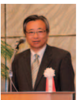
懇談会開会挨拶の森副会長