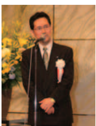
懇談会閉会挨拶の坂東副会長