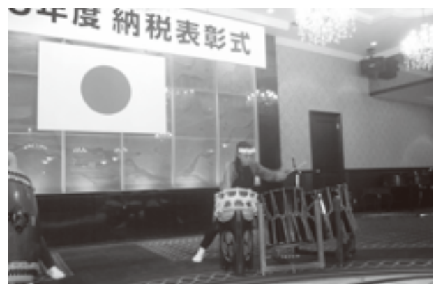
和太鼓による熱演