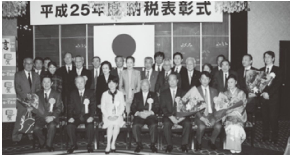
玉川法人会受賞者一同

た。受賞作品は絵そのものも大変うまく、作品を描いた児童は、税のことをよく考え、税について正しく理解できていると感じました。同時に、中学生の「税についての作文」の表彰も行われましたが、受賞された中学生の作文は、本当に中学生が書いたのかと思うほどの意義や役割についてよく学ん