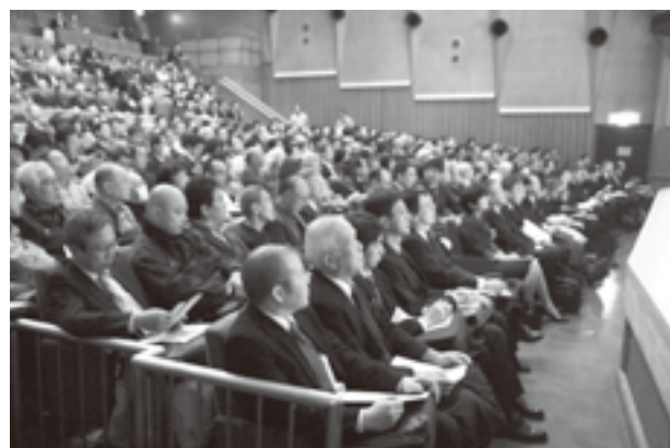
会場をうめた聴衆

しかし、雪深い地方に住む年金生活の老人にとって、暖房のための軽油代が毎月3万円かかるのは