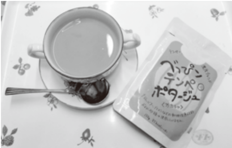
カボチャとテンペを牛乳又は豆乳でミキサーにかけたポタージュです。 夏は冷製で美味しくどうぞ。

発酵食の中でも（テンペ、納豆）の外に熟成したチーズもポリアミンの宝庫という事です。 私もテンペは、以前テンペとは知らずチョコをコーティングした物を食べた事はありませんが、食材になるのは知らず、この度ある機会があり製造、販売している企業に行き色々教えていただき、現在健康食品が沢山出回っている中の1つですが、遺伝子組み換えなしの国産大豆100%で作られた食品なので時には料理に使って試してみようかと考えています。生活習慣病や老化や炎症が原因なら、