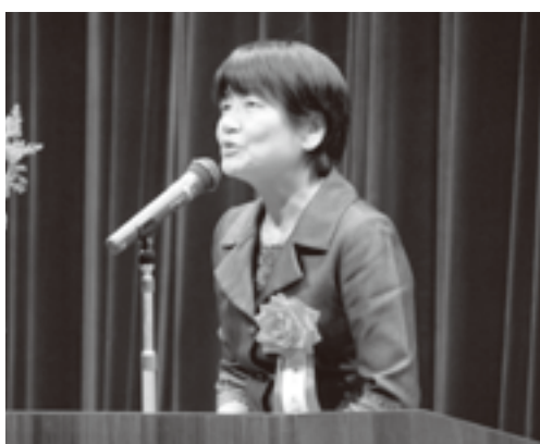
玉川税務署 太田署長

国税庁ホームページには、所得税の申告書などが作成できるコーナーがあります。このコーナーをご利用いただくと、税額などが自動計算されますので、手書きで申告書を作成するよりも簡単に正確な申告書を作成することができます。また、各種の申告書や申請書の用紙がダウンロードできたり、路線価を調べたり、動画の番組を視聴することもできます。是非この機会に国税庁ホームページにアクセスしてください。