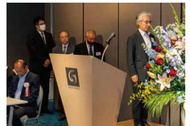
「絆ポイントキャンペーン」表彰の各支部長