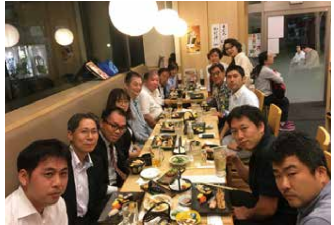
新入会員の皆様とともに