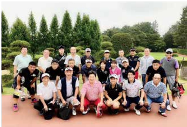
名門 よみうりゴルフ倶楽部にて

コンペ終了後のパーティーは、第9支部会員の居酒屋ネパール料理「モナルダイニング 用賀」にて行いました。オーナーは来日約20年、市場