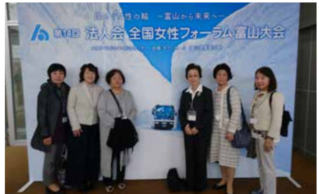
女性部会 今年も頑張りました

第2部の式典では、「税に関する絵はがきコンクール」が各地域の租税教育で重要な活動になっ