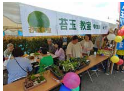
多くの方が参加されました