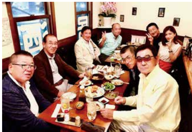
共に頑張りました！