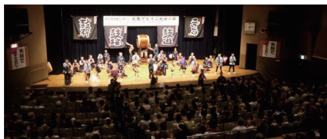
多くの皆さまの心を打つ演奏が繰り広げられました