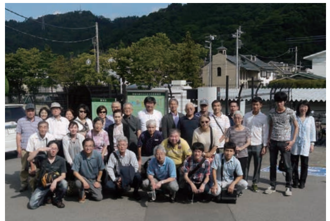
元気くん1号機の前で（真後ろ左の黒い部分が水車です）