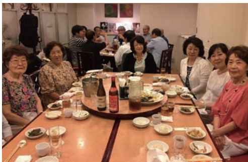
女性陣は皆さまカメラ目線で♪