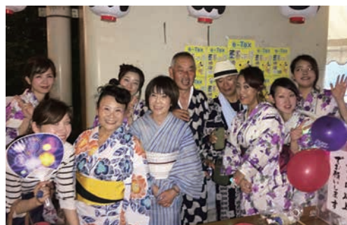
役員の皆様 お疲れ様でした