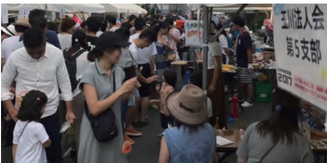
大盛況のサマーフェスティバル

商店街の中程にブースを構え、行き交う子供たちに「税金クイズを行った人には、フェスティバルで使用できる100円のお楽しみ券を差し上げますよ!」と呼びかけると、400名もの子供たちがクイズに挑戦し、法人会としてサマーフェスティバルの盛況に花を添えることができました。