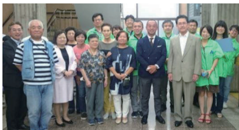
玉川法人会メンバーも みんな笑顔でお手伝いしました