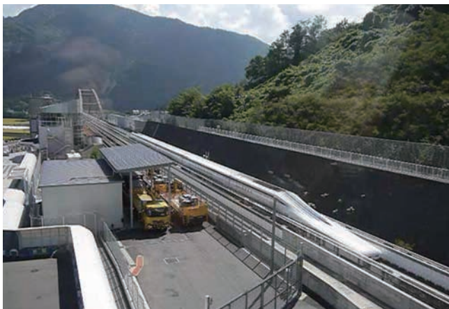
疾走するテスト走行の様子

昼食後は、都留市に戻り、家中川小水力市民発電施設「元気くん」を見学しました。発電機