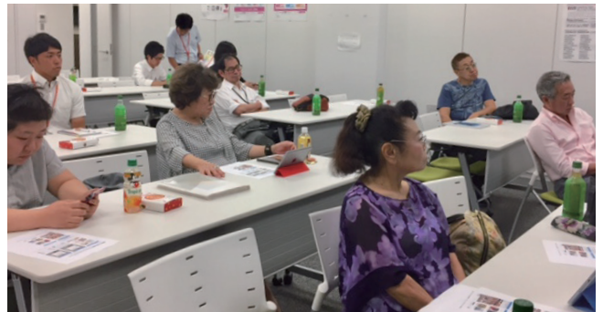
こんなこともできるんだあ (受講風景)