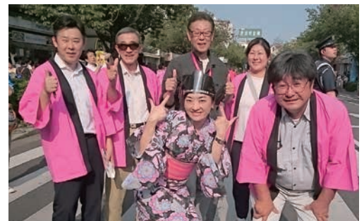
ガンバリました (役員の皆さん)