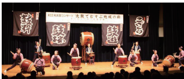
大人も子どもも力をあわせて！