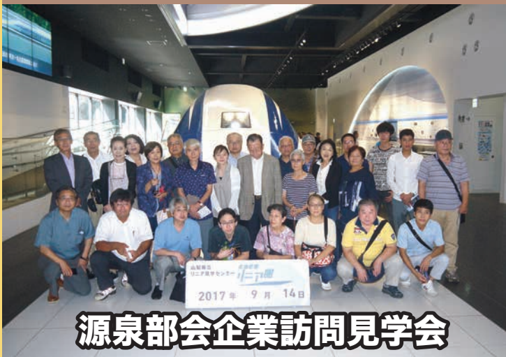
源泉部会企業訪問見学会