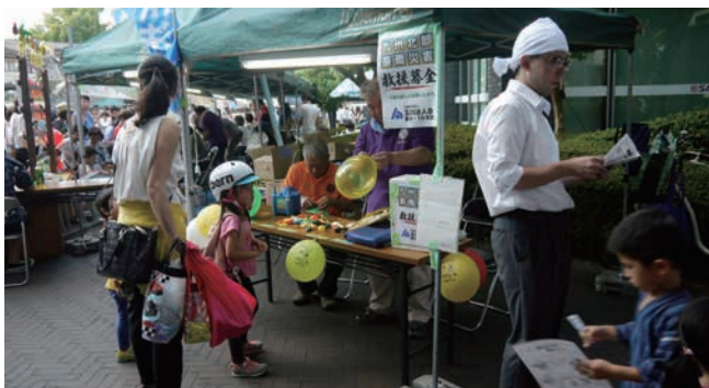
子どもが喜ぶ「e-Tax風船」と「税金クイズ」

今年は両日ともに良い天候に恵まれ、沢山の子どもたちで賑わい「金魚すくい」や「ヨー