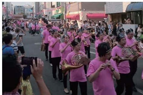
30周年記念パレード