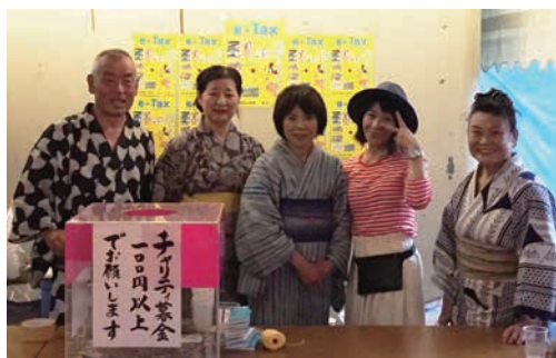
チャリティー募金 ありがとうございます