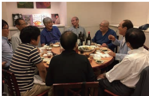
男性陣は会話が盛り上がってます