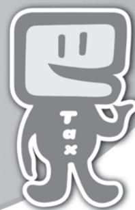
国税庁 e-Taxキャラクター イータ君