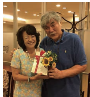
支部長をバトンタッチしました