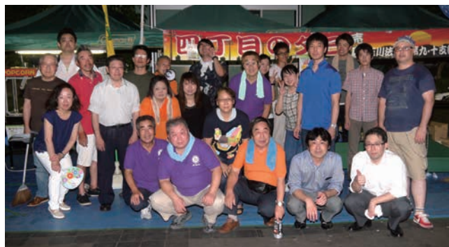
皆さんお疲れさまでした