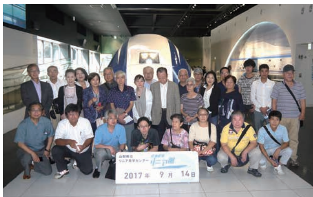
実物展示のリニアモーターカーの前にて

10時30分ころ、山梨県立リニア見学センターに到着し、実物車体の展示前にて記念撮影を行った後、館内を見学しました。テストに使われた実物車体の内部見学をしましたが、意外と