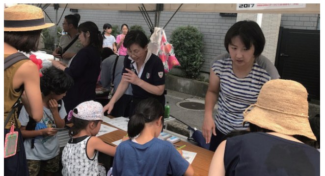
たくさんの子どもたちが参加しました