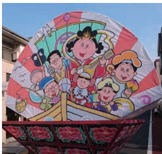
自慢のサザエさんねぶたです