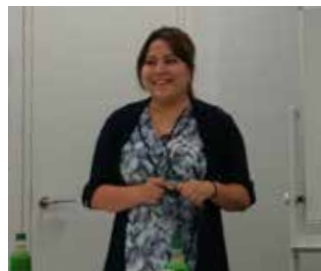
まずは、自己紹介から

第2支部主催による「おもてなし英会話教室」を6月29日、7月6日に開催いたしました。「英語は度胸」をモットーに、学ぶよりも慣れることを目的とした教室で、参加者同士ペアを組んでの実践的練習をメインに据えたカリキュラムです。