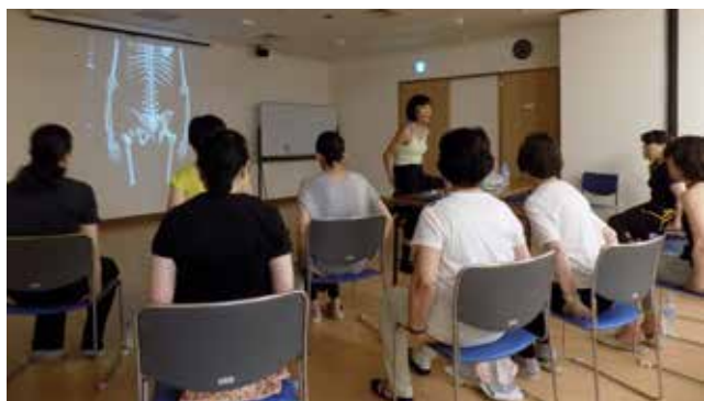
真剣に受講する皆さん