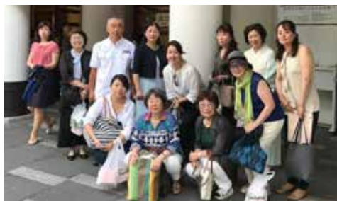
見栄をきった役者さんよりステキですよ