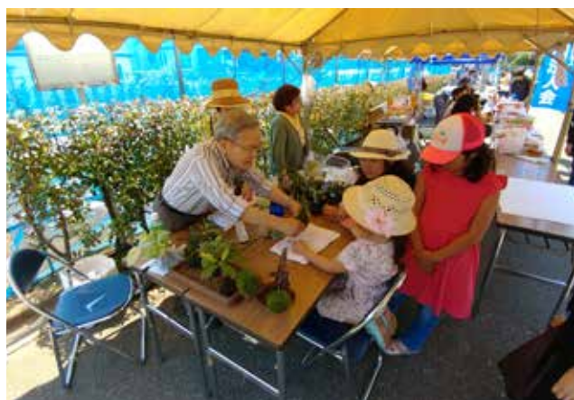
このほうがきれいになるヨ