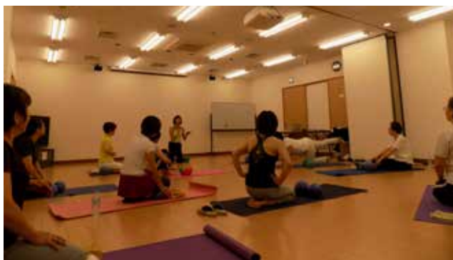
硬い身体をほぐしつつ