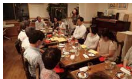
フランス語を交えての説明にウツトリ?!