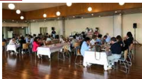
たくさんの皆さんが参加しました