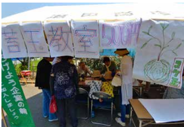
苔玉教室は人気がありました