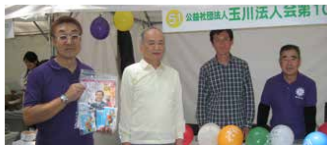
盛況だった「ガーデニングフェア」