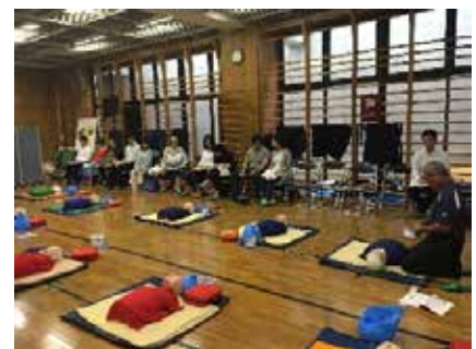
開始前の会場風景 皆さん緊張しています