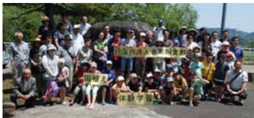
14回目を迎えた体験学習です

地元の市長様、JAの方々のご挨拶のセレモニーをいただいたのち、いよいよ田植えです。経験のある子は自らすすんで田