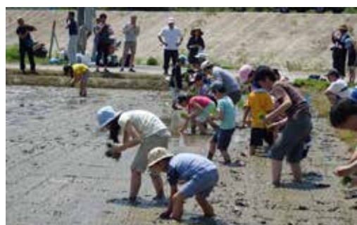
日本一おいしいコシヒカリの田植えです