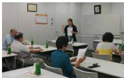
ご自身の自己紹介の内容を検討中