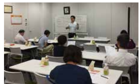
お仕事内容を英語で話してみよう！