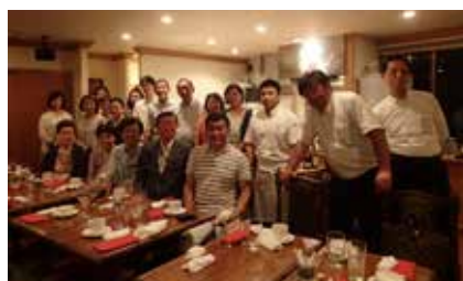
美味しい料理に至福のひとつき