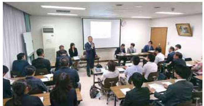
真剣に耳を傾けます