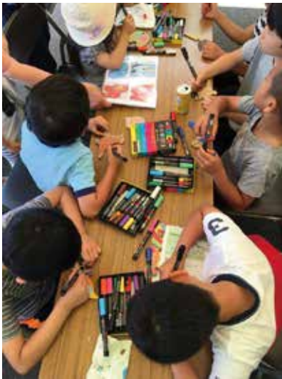
子どもたちに大好評!

今年は、大会に参加されるお子さん連れのご家族などに向けて、“ダンボールオーナメント”づ