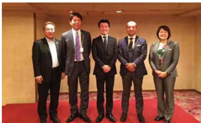
北の大地を踏みしめて