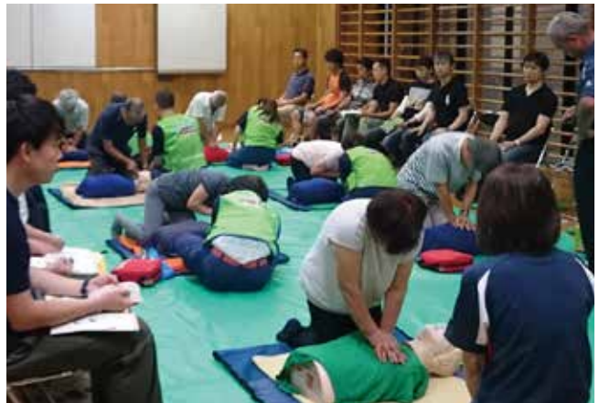
大事な手当の実地訓練