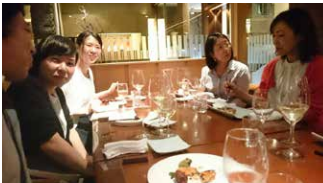
おいしいワインと楽しいおしゃべり

「おいしいワインである前に、その土地固有の繊細さを表現した本物のワインでなくてはな