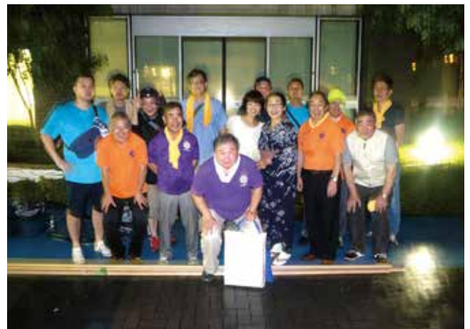
皆さんお疲れさまでした