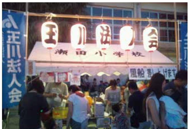
e-Taxの風船は人気があります