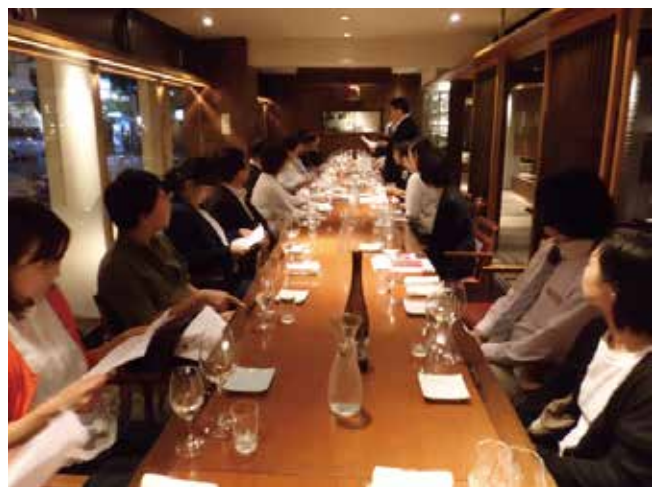
真剣にワインのお勉強です