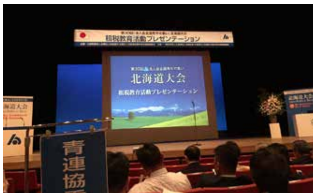
様々な成果が発表された会場