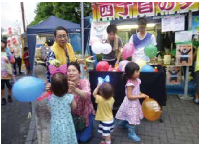
子供が喜ぶ「e-Taxの風船配り」