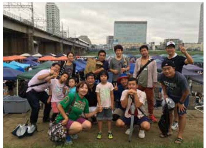
家族みんなで楽しめました！