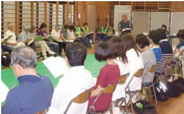
応急手当の大切さを学ぶ