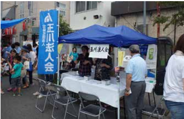
法人会が一番良い場所に