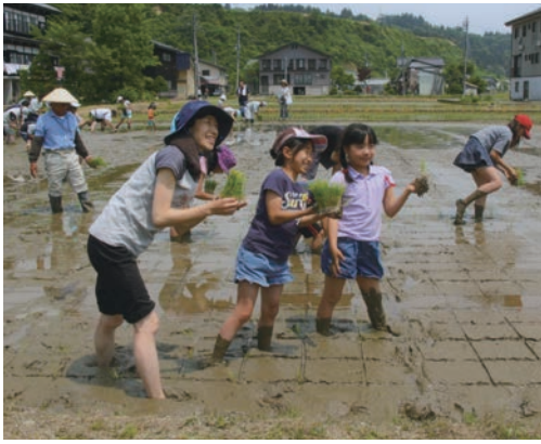
実りの秋が楽しみです

去る5月21日(土)、第13回田植え体験学習が好天気の中、新潟県魚沼市において開催されました。午前7時に等々力に集合した等々力小の生徒さん、ご父兄、そして玉川法人会第4支部役員の一同行はチャーターしたバスに乗車し、一路新潟県魚沼へと出発しました。忘れもしない第1回の田植え体験学習は、平成16年の春に苗を植え付け、9月に稲刈りを行い、「さ