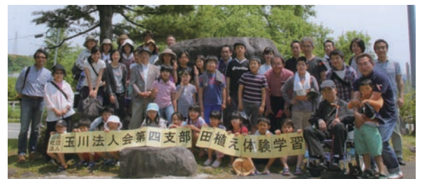
今年も全員揃って記念撮影

あ新米のコシヒカリを応援いただいた皆さんにお配りしよう」と、配送などの手配も万端に整えていた矢先の、10月23日に痛ましい中越地震に遭遇してしまいました。