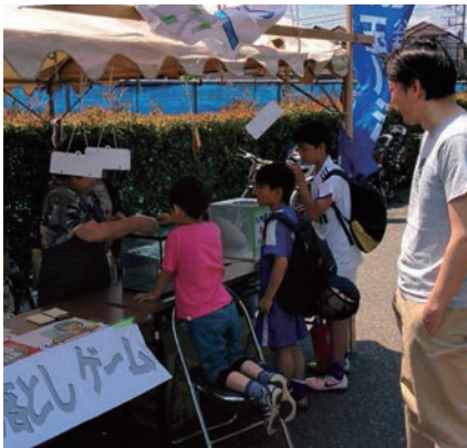
コイン落としは子供たちに人気でした

日時：5月21日(土)・22日(日) 10時～ 場 所：瀬田五丁目フラワールランド 参加者：16名