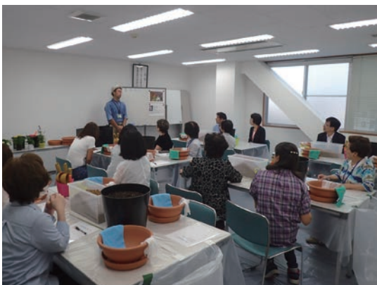
楽しくアレンジメントができました

㈱ユー花園の担当の方の説明のあと、それぞれ好きな植物を選びプランターにセツトしました。作