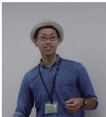
㈱ユー花園様 丁寧に教えていただきありがとうございました

私は、クササントンカ、アイビー、ユーフォルビアをバランスよくプランターに活かしました。丁寧に育て