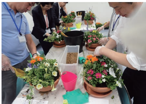
真剣に製作中です

7月6日(水)レイクウッドゴルフクラブ(西コース)で平成28年度第1回ゴルフ同好会コンペが開催されました。 参加人数は45名、協賛してくださいました会社は4社。 当日は最高のゴルフ日和で、気