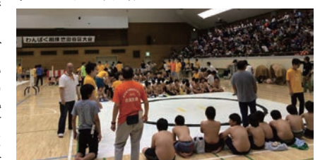
子どもたちの真剣な取組が印象的でした

わんぱく相撲など、地域に根差した活動に、我が玉川法人会青年部会が、少しでも何かの役に立てたとしたら、とても喜ばしいことです。実行委員の皆様とも連携し、これからもイベント協力などで、地域を盛り上げていきたいと思えます。