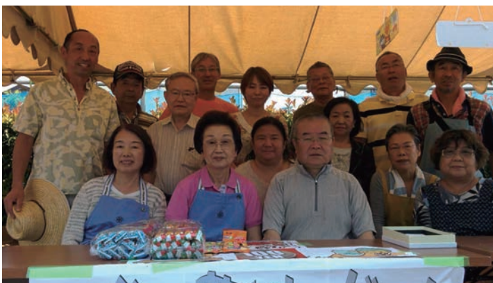
スタッフの皆様、お疲れ様でした