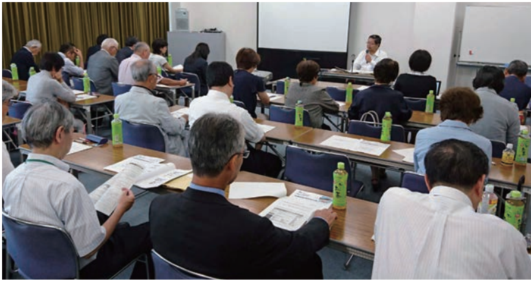
関心の高かった消費税軽減税率研修会

平成28年6月21日、玉川税務署大会議室において研修委員会主催の「消費税軽減税率対策セミナー」が開催されました。雨という梅雨らしい天候の中、39名の方が参加。先送りされたとは言え軽減税率に対する関心の高さが伺えました。