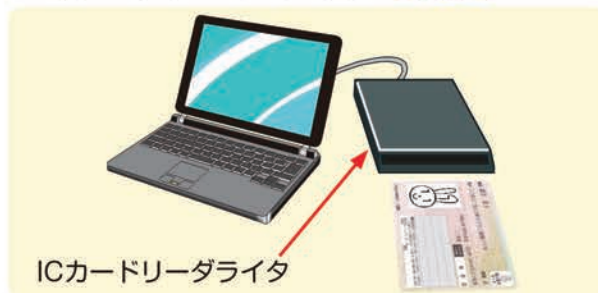
ICカードリーダライタ

※マイナンバーカードの交付に関するご質問については、住民票のある市区町村窓口へお問合せください。