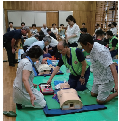
この器具の使い方は???