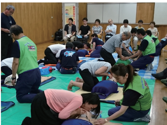
実践しながらの講習 みな真剣です

日 時：7月12日(火) 13時30分～16時30分 場 所：玉川消防署 地下 参加者：29名