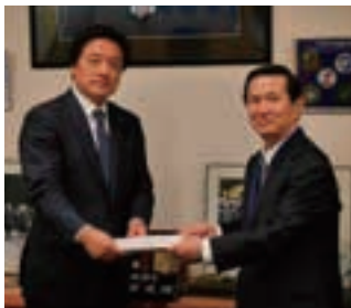
選挙区選出代議士 若宮防衛副大臣(左)へ「平成28年度税制改正要望書」の提出

「平成28年度 税制改正の提言」を、大島委員長に事務局長が同行し、11月16日(月)に衆議院議員若宮健嗣氏、11月20日(金)に世田谷区長保坂展人氏を訪問し、手渡ししてきました。