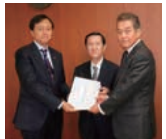
保坂展人 世田谷区長(左)へ「平成28年度税制改正要望書」の提出

保坂区長には①地方のあり方②行政改革の徹底③地方税関係についての提言書をお渡ししました。区長から