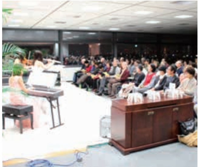
大盛況のコンサート

今年は「天空のコンサート」と銘打ち、11月21日(土)に用賀駅上SBSビル23階にある、株式会社東京組様のショールームをお借りして開催されました。例年来場者が40人前後のコンサートですので、今年も優雅にお聴きいただこうと考えていたらとんでもない。今年はなんと175名の来場者があり、第9支部会員はもちろん東京組の従業員さんにもお手伝いいただき、無事終了することができました。東京組様には本当に感謝しております。