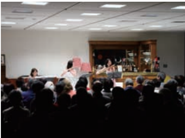
素敵な演奏でした