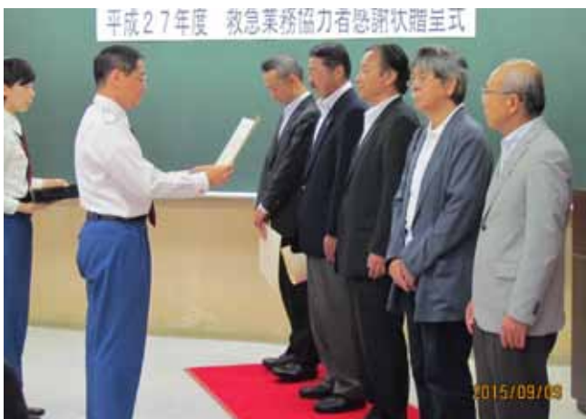
応急救護技術の普及促進に感謝します

玉川法人会では、これからもこうした救命救急活動を実施していきますので、皆様のご参加をお待ちしています。