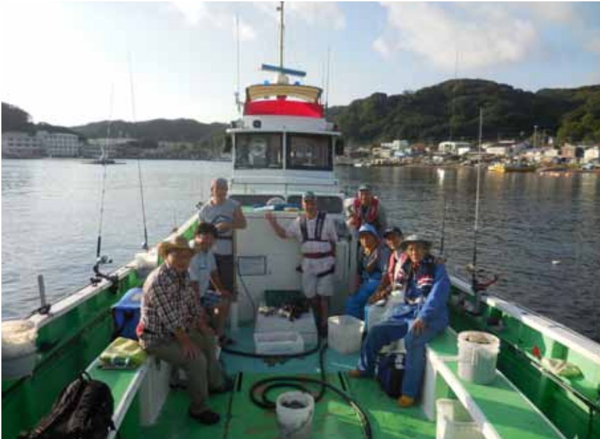
釣果を期待していざ出船

日 時 9月13日(日) 6:30～ 釣り場 横須賀走水「教至丸」 出席者 8名