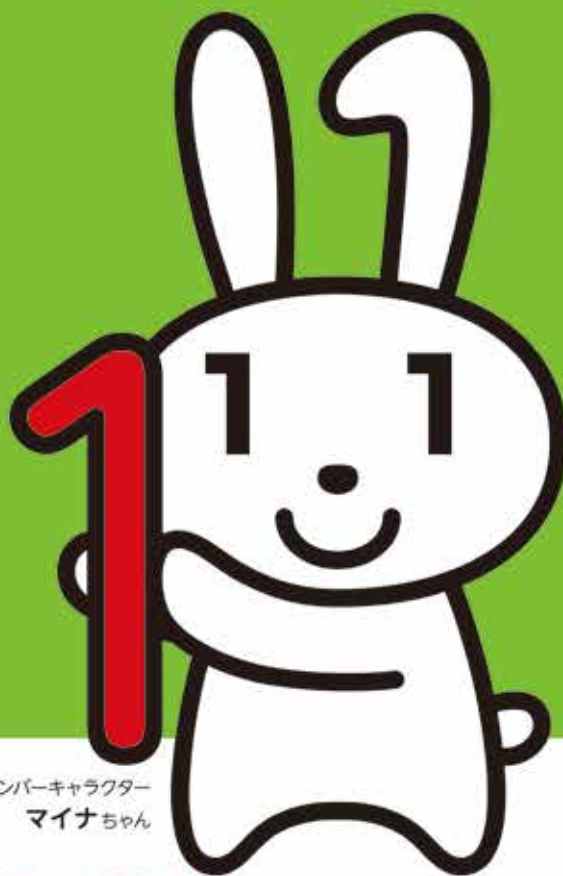
マイナンバーキャラクター マイナちゃん