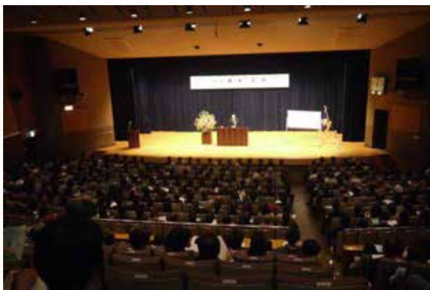
駒澤大学深沢キャンパス120周年記念アカデミーホールでの講演会