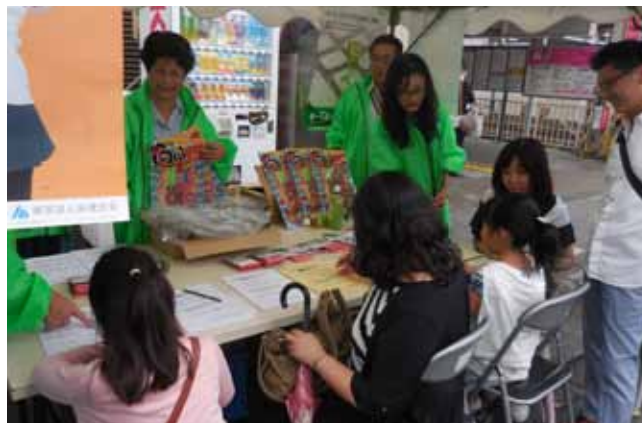
お子さんも喜んでクイズに参加しました