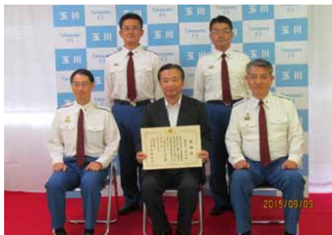
感謝状を手にする森副会長