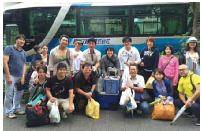
みんなで楽しい1日を過ごしました