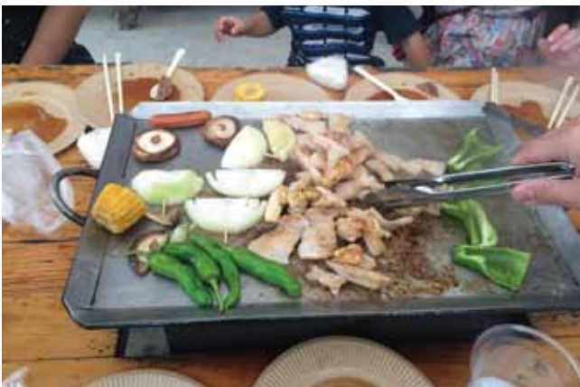
大人気だったバーベキュー