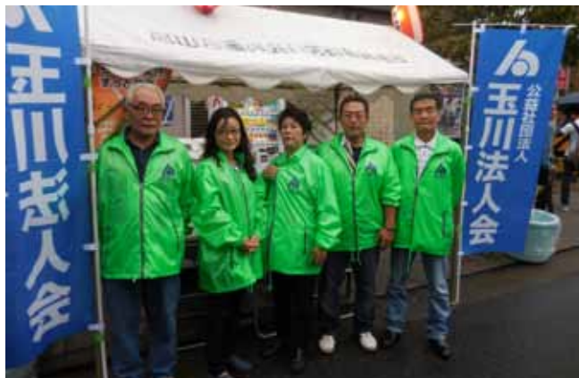
役員の皆様お疲れ様でした