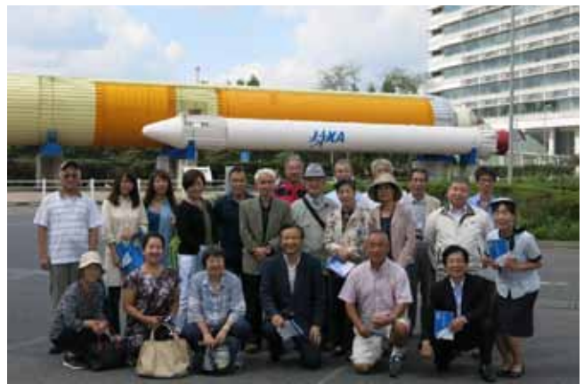
企業見学会に参加の皆さん