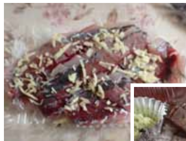
丸山さんお手製の アジの刺身↑ サバ→