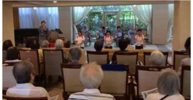
三味線の音色と民謡と一緒に楽しみました