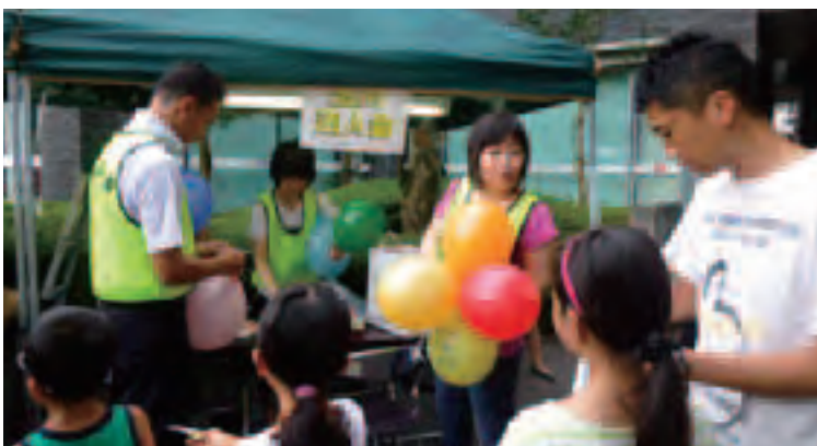
賑わう税金クイズのブース

毎年恒例の税金クイズは、配布のみで家に持ち帰ってご記入いただくものだったのでスムーズに配ることができました。同時に無料配布した「イータ君」風船600個は、今年も城南信金さんのご協力をいただきました。ヘリウムガスが使えなかったので会場に林立することはありませんでしたが、あちこちに華やかな色を添えていました。それと今回は恒例の子供達に大人気の「縁日」、「4丁目の夕日」は、今年より支部事業とは分離し、両支部有志の皆さんが集まって出店し、夏休みに入った