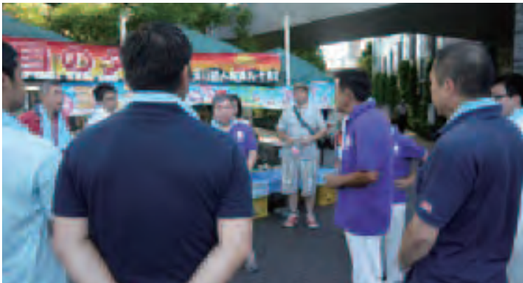
開始前のミーティング

今年も小中学校の夏休みの始まりに合わせて、第9支部及び第10支部の支部会員有志や関連会社の皆さん、延べ80名の方が用賀商店街振興組合主催の「サマーステージ27」に参加致しました。