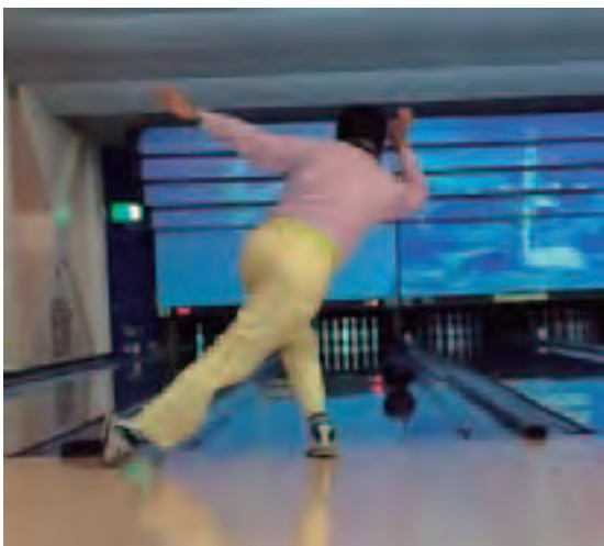
上平プロ?のビューティフルな投球フォーム