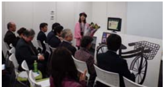
好評の研修会でした

研修委員会では、これからもこのような事業運営に役立つ研修会を計画していきますので、どしどしご参加下さい。