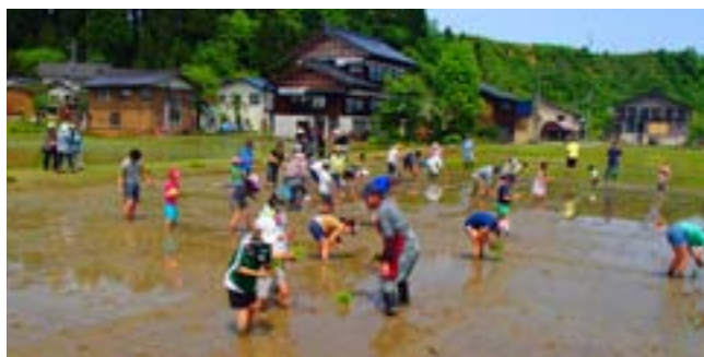
26年5月に行った田植え風景