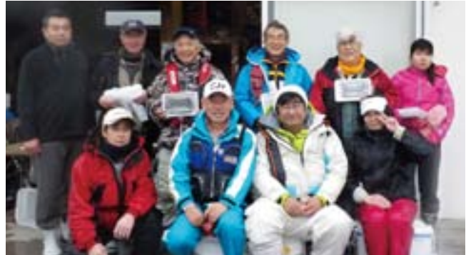
釣果に満足の笑顔です。