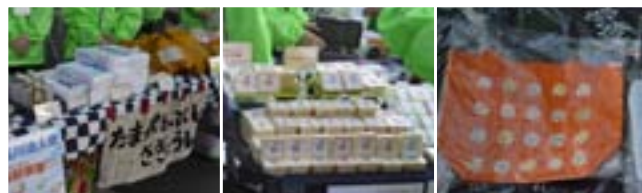
(左) 玉川福祉作業所さんの商品たち (中央) STORYさんの万能石けん (右) 用賀福祉作業所さんの色とりどりバッグ