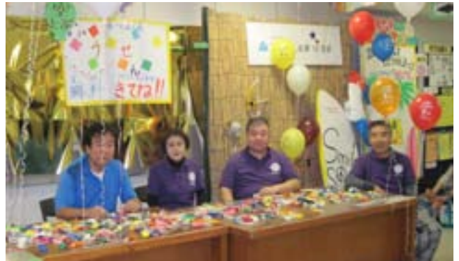
役員の皆様、お疲れ様でした