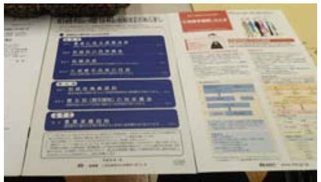
当日の講義資料です