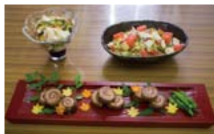
大皿に盛り付けられた料理の一部