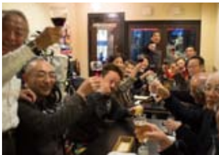
二次会にて祝杯を挙げる参加者の皆さん

で行ないました。根来第2支部長にもご参加いただき、また、協賛4社より賞品の提供もあり、なごやか