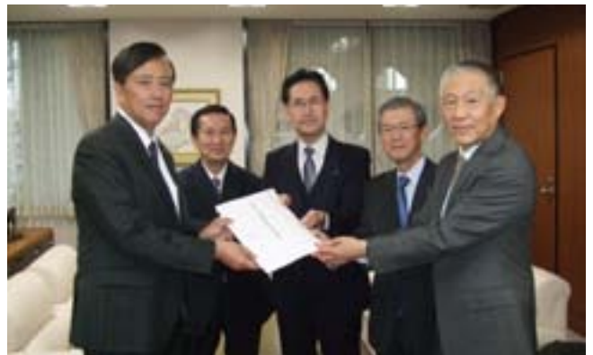
保坂区長に要望する大島委員長(左から二人目)と坂東副会長(中央)