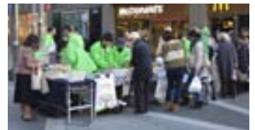
たくさんのお客様が足を止めてくださいました

主にクッキーやケーキのほか、この時期にぴったりのシュトーレンも並びました。お馴染みの味!とすでにご存知のお客様にも好評でした。その隣は、「玉川福祉作業所」さん。コットン100%で何度でも使える布巾“たまぴかクロス”や、織機で織った鍋敷き、一針一針刺繍そのものがデザインになったバッグなど、デザイ的なにも優れた小物が集まりました。さらに、