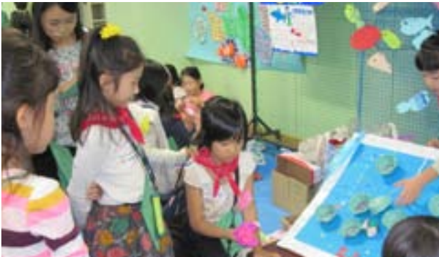
熱心にゲームに興じる子供達