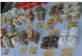
パイ焼き窯さんのクッキーやケーキ

社会貢献委員会では地域の作業所さんを支援するため、和太鼓コンサートなどの事業内で商品を販売する機会を増やしています。第1回目