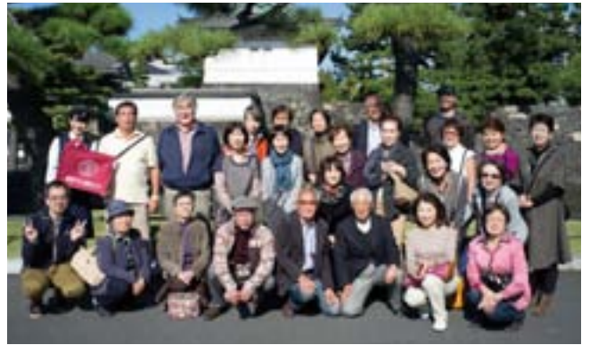
皇居前にて、にこやかに