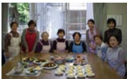
調理を担当した支部の皆さんと料理の先生(中央)を囲んで