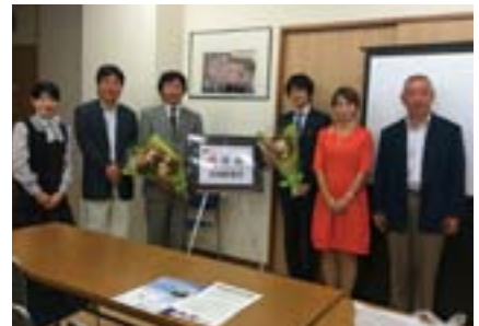
講演者の皆さまと企画担当した支部役員とで記念撮影をしました。