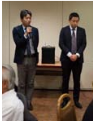
AIU保険担当者の皆さん