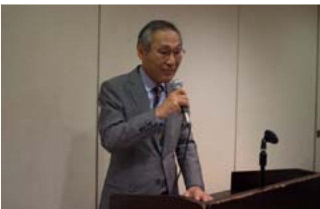
大鎌組織委員会担当副会長