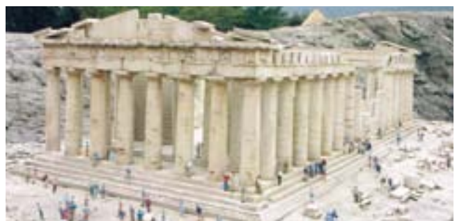
本物と見まごうパルテノン神殿