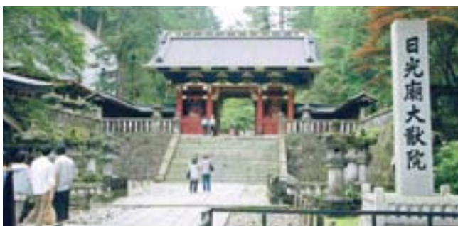
世界遺産の日光東照宮

その後東北道に入り、鬼平江戸廻としてリニューアルした羽生サービスエリアで最後の休憩をして、事故、怪我もなく、無事朝の集合場