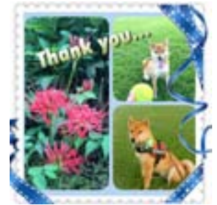
iPhoneで複数の写真をまとめたりデコレーションをしました