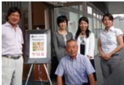
合同開催のパネル前で…

iPhoneをお持ちの方々は、メールや電話の機能と同じぐらいカメラをお使いになっていま