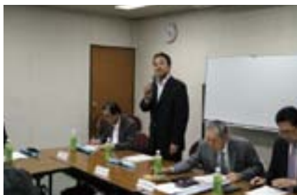
東山副署長のご挨拶