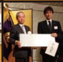
お楽しみ抽選会は、例年どおり豪華賞品が数多く用意されました。