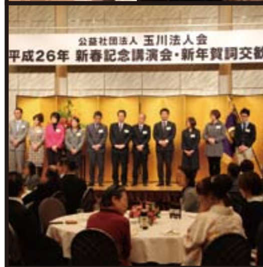
公益社団法人 玉川法人会 平成26年 新春記念講演会・新年賀詞交歓