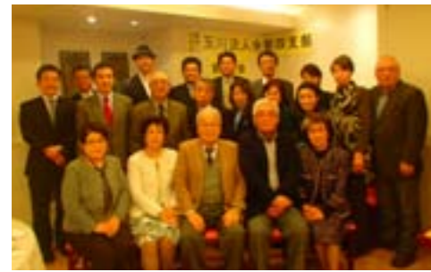
楽しく集った第4支部懇親会