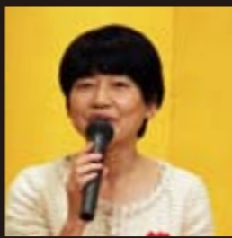
阿部会長の新年お祝いのご挨拶につづき、玉川税務署長、都税事務所長からもご挨拶いただきました。