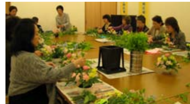
作品作りに奮闘中