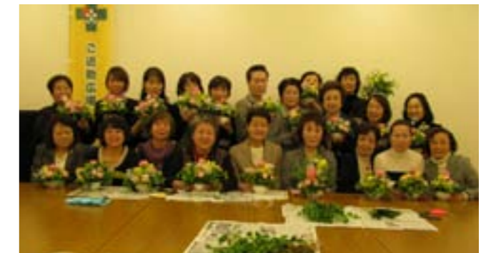
出来上がった作品にみんなニコリ