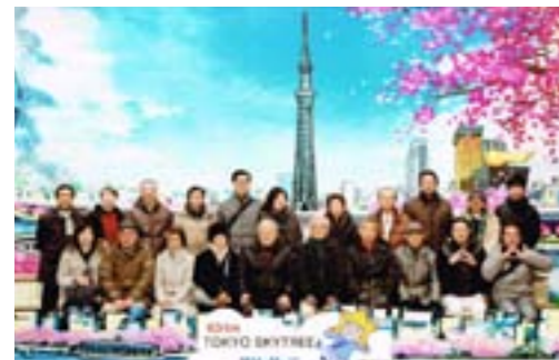
記念撮影をパチリ

早速記念撮影、そしてエレベーターに乗って350mの展望デッキに向かう。そこからエレベーターを乗り換え、450mの展望回廊へと一気に上がった。450mからの眺めは圧