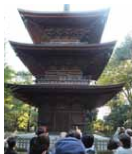
豪徳寺で三重塔を見上げる参加者たち

最後に東京農業大学が運営する「食と農」の博物館を見学して、農大を出身された方が地方の生産者と協力して開発した新たな珍しい食材をお土産として購入しました。