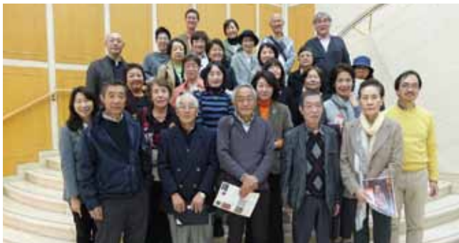
世田谷美術館のロビーにて記念撮影

こうして絶えず訓練を受けながら日々技術の鍛錬を重ねているからこそ、世界一優れた水道設備の恩恵を私たちも享受できているのだと感じました。