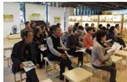
農大博物館でユーモラスな説明を聞く

また何よりも心に残ったのは、どこの見学場所へ訪れても、対応して下さった係の皆さんがとても親切だったことです。世田谷は本当に良い人が多い街なのだということ印象をさらに強く持つことができました。