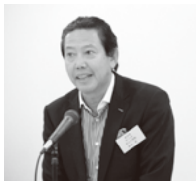
開会あいさつの若山副会長