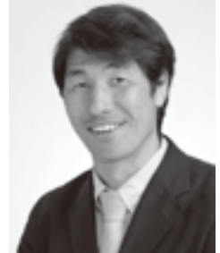
株式会社アクエリア Aquaria Design Ltd.

クライアント様が何を求め、発したい方向性を理解し、それ以上のモノを仕上げる姿勢で必要不可欠な一緒に成長し続けるパートナーを目指します。