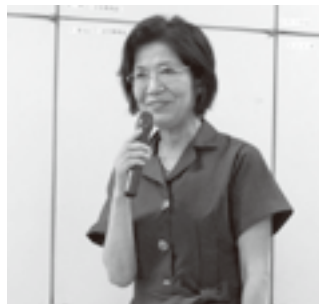
司会の松野副支部長