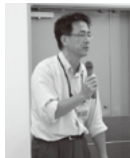
着任された小竹第1統括官