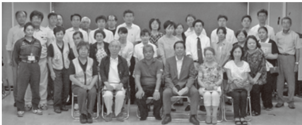
社会貢献委員会主催：普通救命救急講習会（6月27日 玉川消防署研修室）