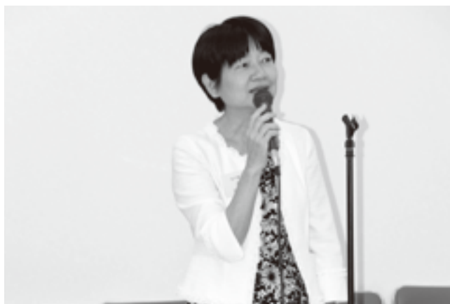
着任のご挨拶 太田署長

参加者紹介の後、署の幹部の皆様と玉川法人会役員とが名刺交換しながら、今後の会活動について活発に意見交換を行いました。