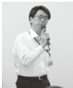
ご挨拶の高田副署長