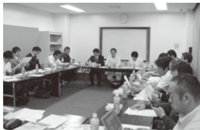
青年部会全体会議の様子