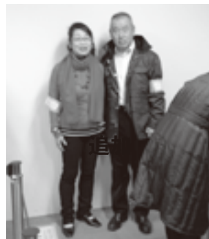
鈴木第6支部長と坂部女性部会第10支部長