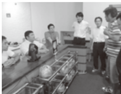
試合前のミーティング

試合は2ゲームのトータルスコアで争われます。練習ができないという一発勝負ルールのため、1ゲーム目から気の抜けない戦いが繰り広げられました。