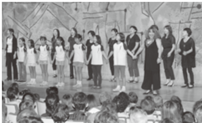
友情出演の「Voice of Love」の皆さん