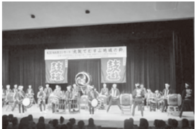
合同演奏の鼓遊と鼓桜の皆さん

落ち着いてから改めて場内を見回して見ると、入場者の年代の幅がとても広いことに気づきます。子供達、若者、壮年、年配者そしてお