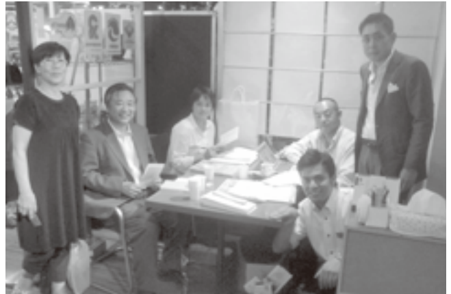
森組織委員長と第5支部役員