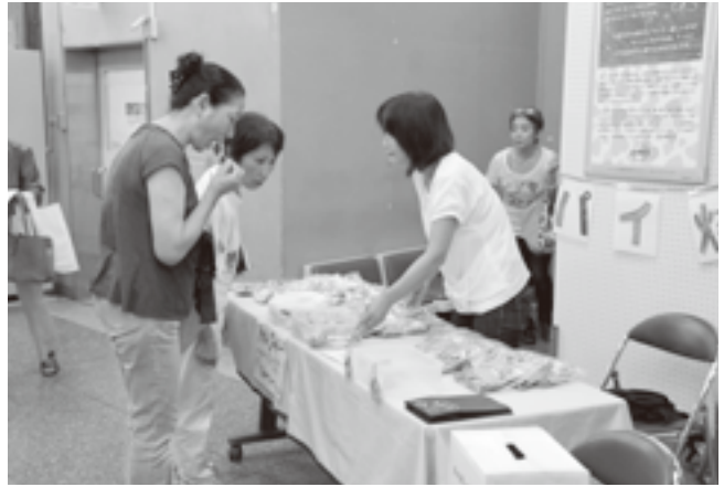
特製和太鼓コンサートクッキーもチャリティーしました