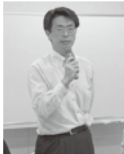
ご挨拶をいただく高田副署長