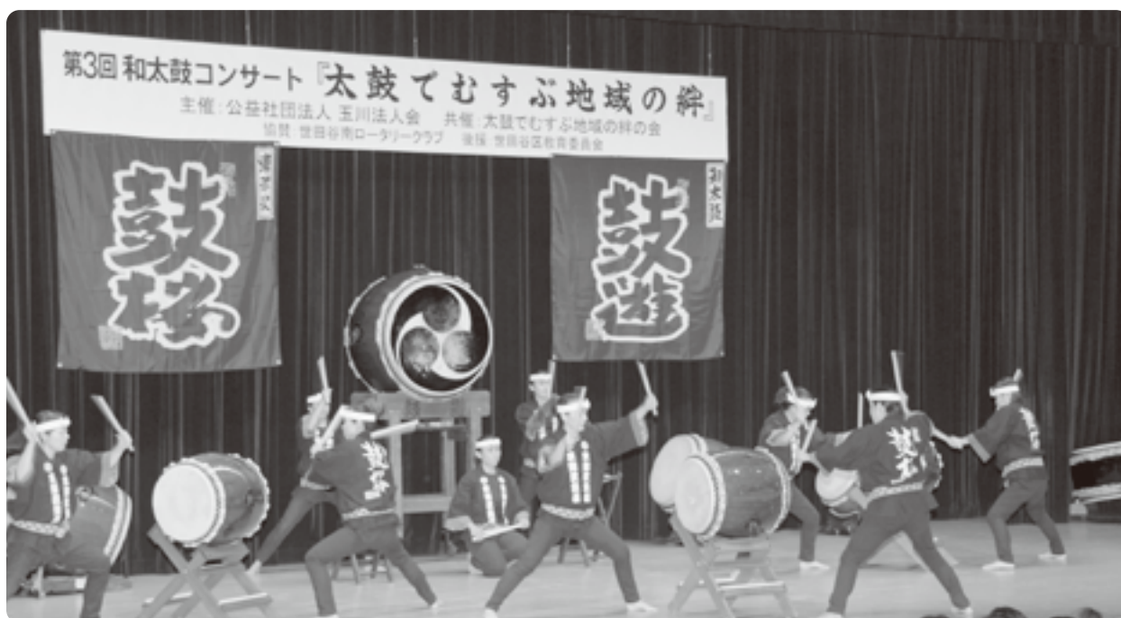
迫力満点の演奏。「鼓遊」(上)と「鼓桜」(下)の皆さん