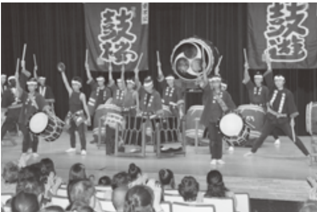
勇壮な演奏をしていただいた鼓遊の皆さん

平成24年9月2日16時から等々力駅前の玉川区民会館ホールにて第3回和太鼓コンサート「太鼓でむすぶ地域の絆」が主催玉川法人会、共催太鼓でむすぶ地域の絆の会、協賛東京世田谷南ロータリークラブ、後援世田谷区教育委員会にて開催されました。