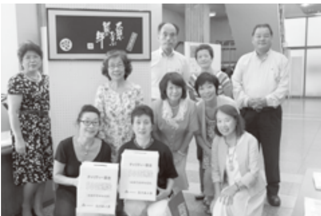
チャリティー募金を担当した役員の皆さん

今年で3回目となり毎年来場者が増え、今回は474名の会場が満席となりました。出演者は稲城市に拠点を置く「鼓遊」さん(第9回国際和太鼓コンテスト最優秀賞受賞や東日本大震災では岩手県野田村・岩泉町へ演奏に行かれたりと活躍されています)、東深沢小学校PTAの方々の「鼓桜」さん、友情出演の東深沢小学校コーラスサークル「Voice of love」さんでした。