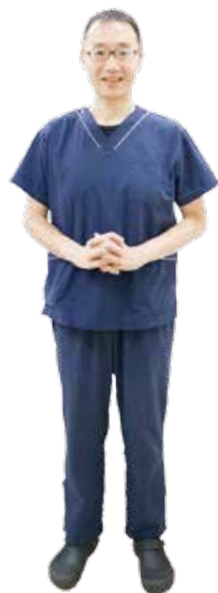
冬城先生プロフィール

産婦人科というのは、女性の一生を診る科だと考えています。思春期から老年期まで、身体だけではなくメンタル面でも、個々に合わせたテイラーメイドなケアが必要なんです。そういったことをもっと知ってもらいたい。知識があれば予防にもなりますし、治療を減らすことができます。たとえば妊娠や出産は決して簡単なことではありません。将来、出産することを選ぶにしても、選ばないにしても、女性のライフスタイルの一部として、ちゃんとした知識は必要ですよ。来年からは産婦人科医としてそんな啓発活動を積極的に取り組んでいきます。ゆくゆくは法人会でも、そういった機会があればうれしいですね。