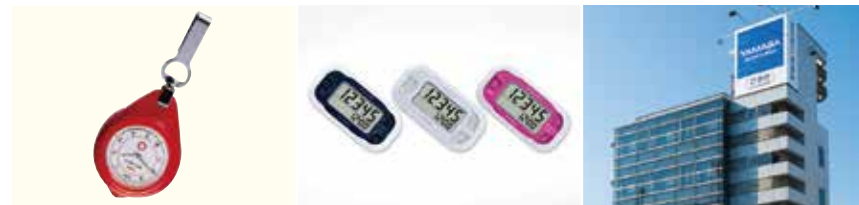
万歩計の第1号機（1965年製） 2018年も新製品続々「らくらくまんぼ」 本社は環状八号線、第三京浜の入口近く

大学を卒業後は経済学部での学びを活かし、1993年株式会社日立製作所へ。財務部門で13年勤務後、2006年入社。1年後代表取締役就任。本社、大阪、埼玉のスタッフ22名を束ねている。