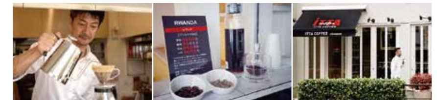
時間と重量をコントロールした丁寧なドリップ 毎日、試飲を用意

〒158-0083 東京都世田谷区奥沢 3-31-10 TEL: 03-6451-7480 営業時間 10:00～19:00 (金曜のみ 13:00～19:00) 定休日 月曜日 http://ittacoffee.com