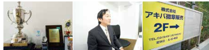
企業の表彰や記念品に好評

創業から約30年。市区町村などの公的機関からの信頼も厚い。スポーツにも造詣が深く、表彰式会場に呼ばれてその場でカップを修正する事も。今はバドミントン、テニスに夢中。