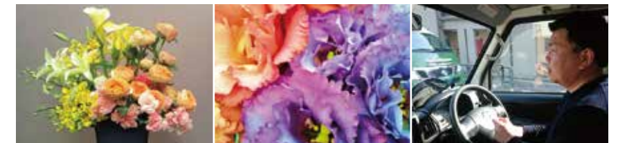
法人会イベントの装花も担当