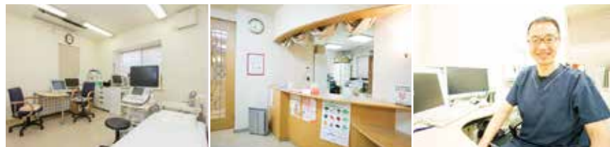
お悩みなどご相談ください

日本産科婦人科学会専門医、母体保護法指定医、日本女性医学会専門医、玉川産婦人科医会会長、慶應義塾大学医学部客員講師。休日は駒沢公園をジョギングしてリフレッシュ。