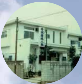
開院当初の外観（昭和43年）